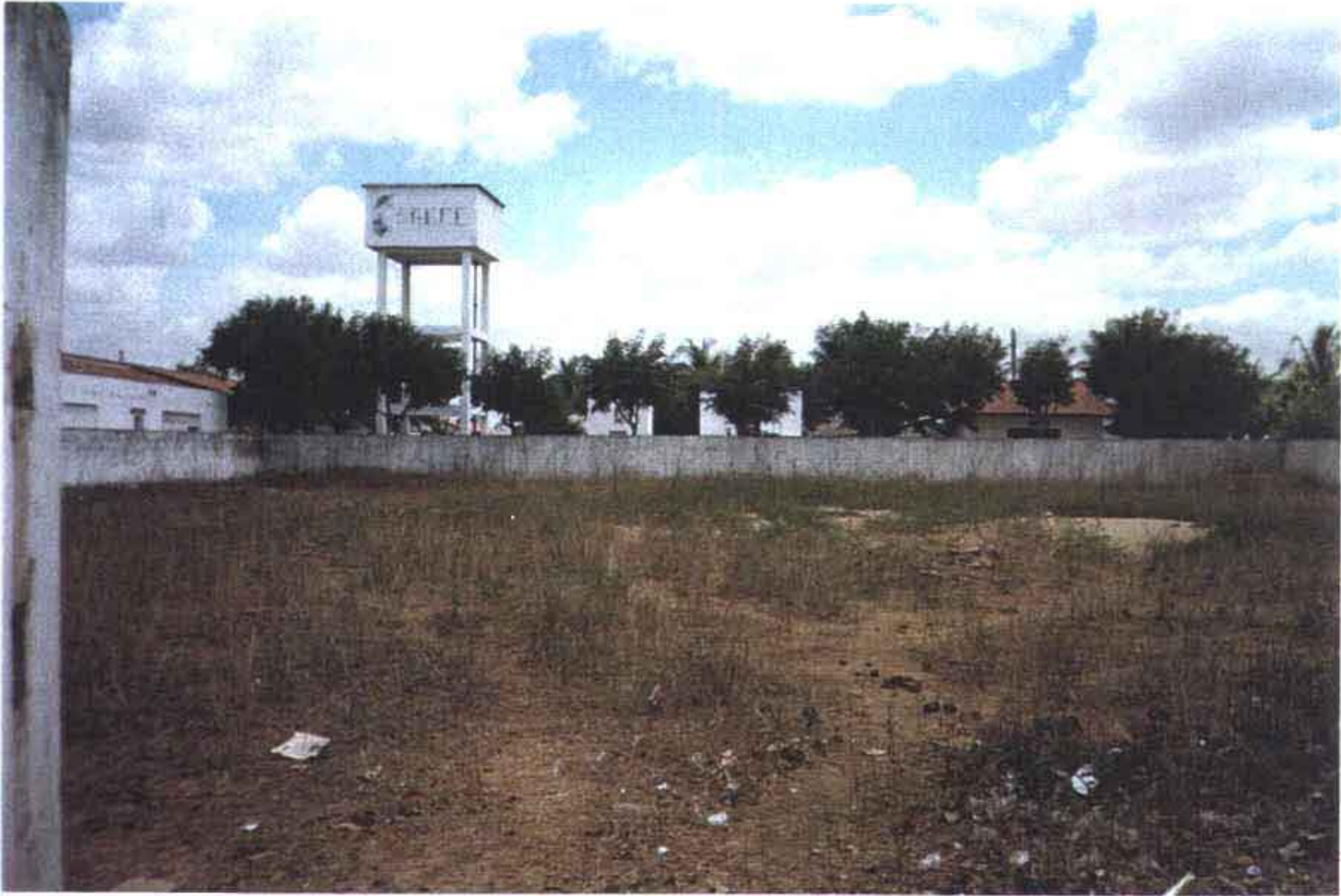
FOTO 2 - VISTA SUPERFICIAL DO TERRENO ONDE SERÁ IMPLANTADA A E.T.A.