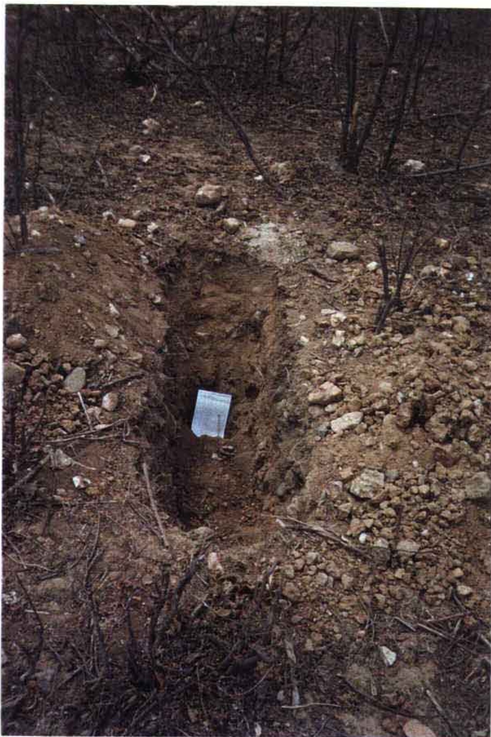
FOTO 1 - FURO DE SONDAGEM A PÁ E PICARETA REALIZADO NO EIXO DA ADUTORA.